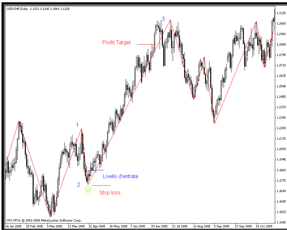
Fig. 1 JOT Setup rialzista su USD/CHF

Il Jump On Trend ( JOT) è un setup che si verifica dopo la partenza decisa di un trend, e si prefigge l'obiettivo primario di avere una grande potenzialità di guadagno a fronte di un piccolo rischio.