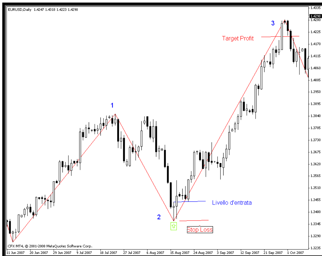
Fig.3 DB setup rialzista su EUR/USD