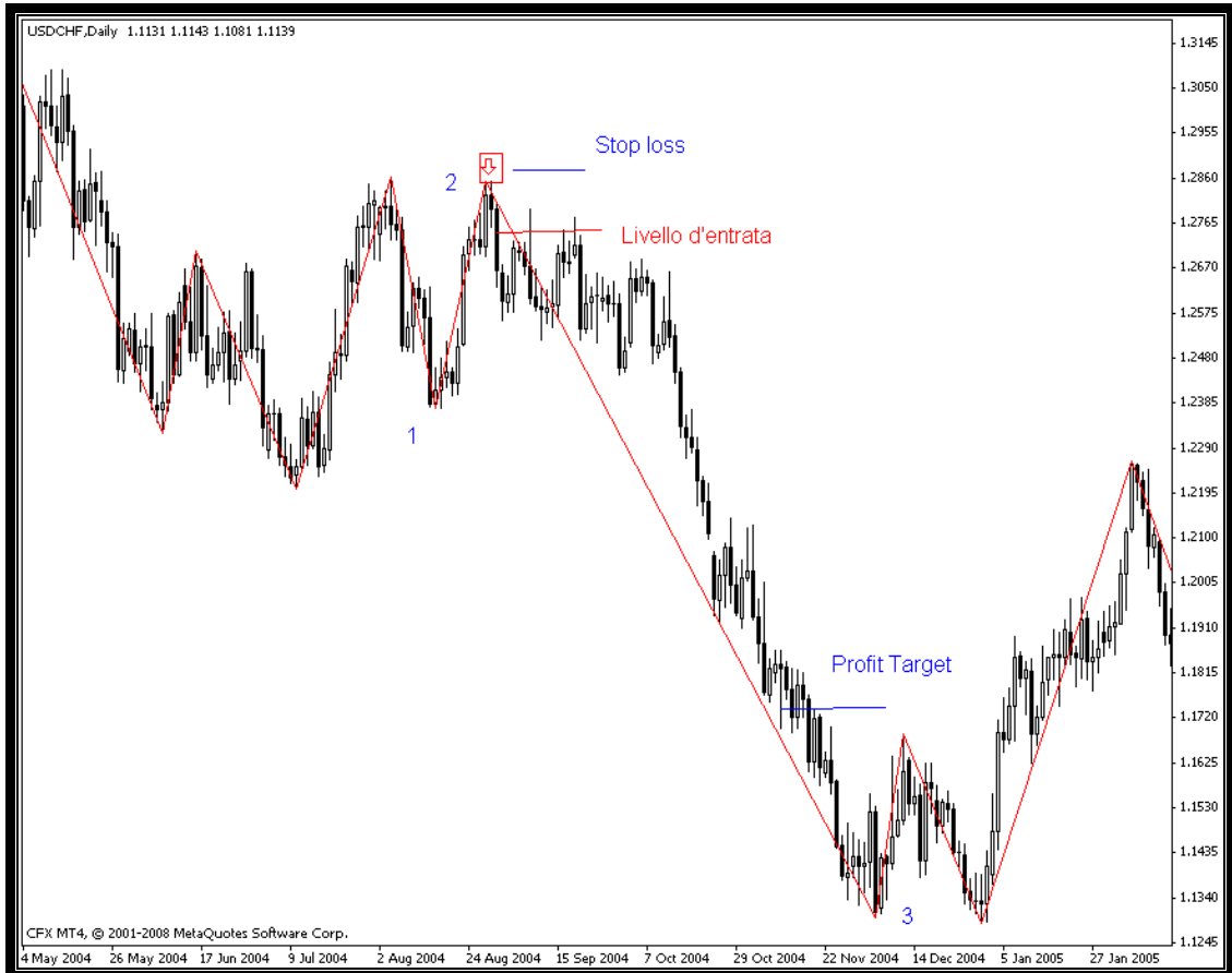
Fig.4 DT setup ribassista su USD/CHF